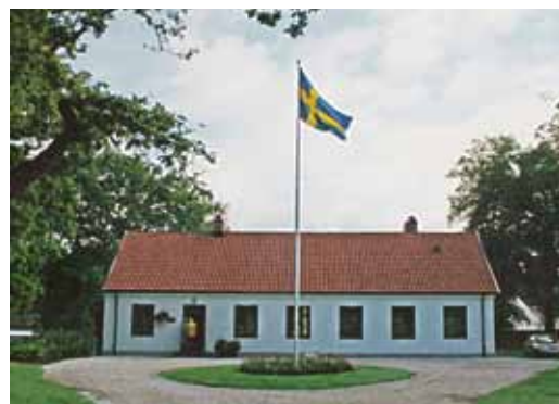
Södra Skåningarnas ny traditionsrum