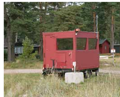
Kontrollstationen vid Fårabäck

Att öppna och stänga grindar genom att hoppa ur bilen är 1900-tal, idag styrs grindarna via mobiltelefon och soldatens medelvikt går upp ytterligare ett kilo.