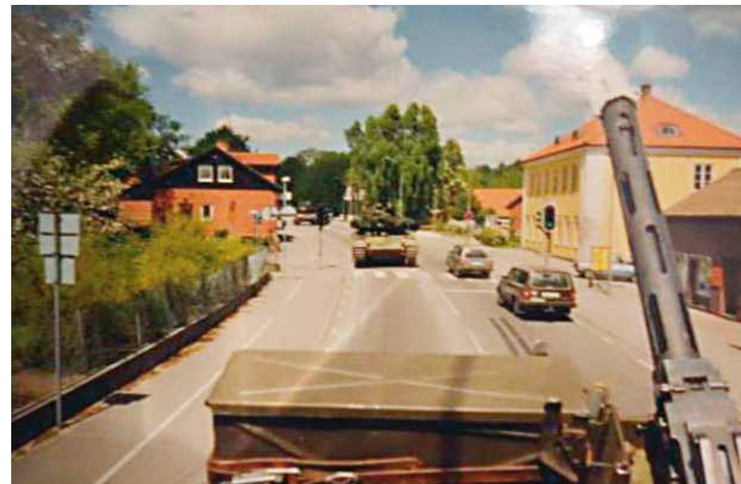
80112 passerar tillsammans med övriga Rönnebergs genom Veberöd på väg mot Ravlunda våren 1984.