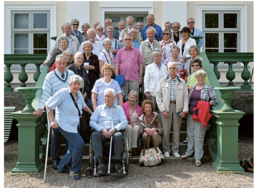
Samling framför Huseby slott.

Eftermiddagen ägnades åt olika museer i Växjö innan hemfärden via Tingsryd och Börjes goda räkmackor anträdde.