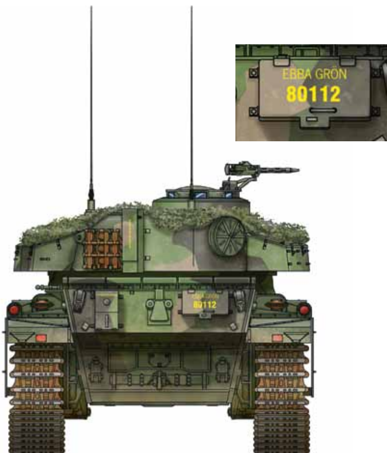
Stridsvagn 102 med fordonsnummer 80112. Besättningen hade utbildningsåret 1982-1983 döpt sin vagn till "EBBA GRÖN" efter en känd svensk musikgrupp.

"Jag minns speciellt att både bränsle och oljeförbrukning var väldigt höga! Hur var det, 60 + 62 gallon i tankarna, på det körde vi 2 svenska mil stridskörning. Det blir väl runt 300 l/mil! Tror det gick 64 liter olja i motorn, och den drack utan vidare 5 liter per dag. Helt otroligt! Den lilla 3-cylindriga (?) Perkins-motorn som drog elverket krånglade aldrig, vi uppskattade allt varmvatten den gav till kaffet! Motorn var lättare att hantera än de på de andra jag testade någon gång, och undvika att de karaktäristiska smällarna som kom då tändningen slog av. Var det vid 2500 varv/min? Motorn gick också lättare igång än de andra då det var kallt. Hade ett allvarligt glapp i radiokontakten mellan chassi och torn. Det kunde ha slutat illa en gång då jag körde ut i ett djupt dike i hög fart utan att höra vad vagnchefen sa.