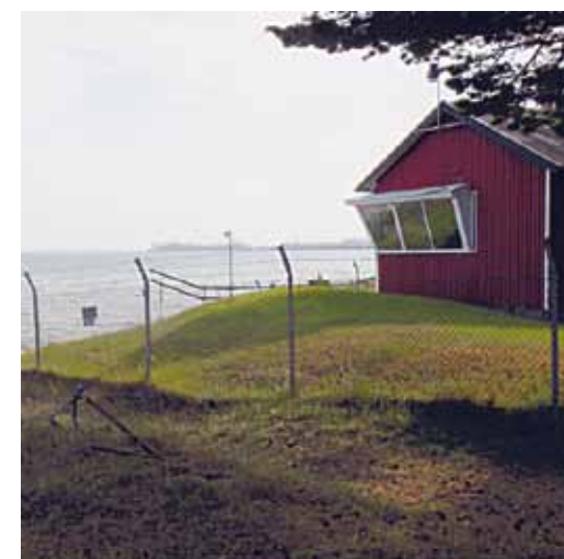
Sjökontrollen med Åhus hamn i bakgrunden

förs inte från fasta eldställningar!", fick vi veta vid vårt besök .