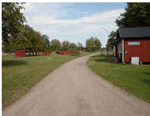
Den gamla Lägergatan numera ganska gles

De flesta byggnaderna har genomgått omfattande invändiga renoveringar och flera nya byggnader har tillkommit och gamla har rivits. Flygvapnets över 40 for-