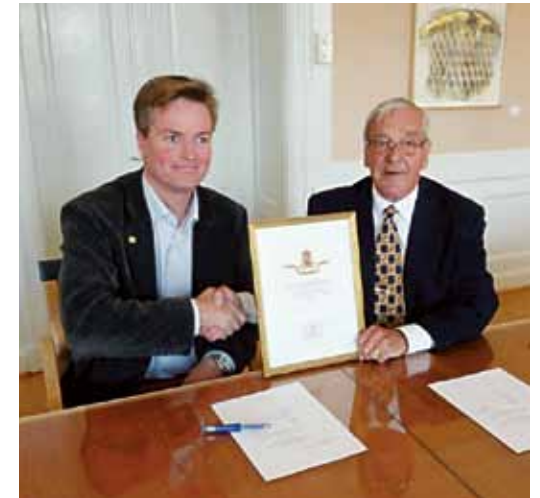
En mottagare och en givare – båda lika nöjda.

I samband med firandet av Döbelnsdagen den 13 september 2012 genomfördes en överlämning av dessa tre kristall-