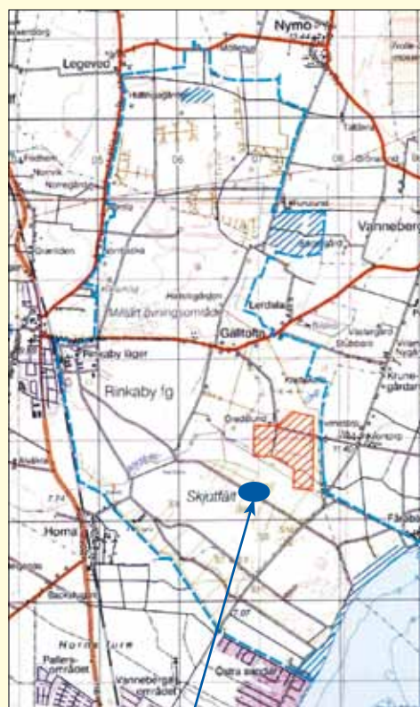
I 6 läger

christer.nyhlen@gmail.com Snödroppsvägen 14, 291 50 Kristianstad