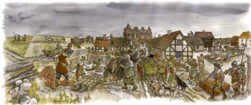
Kristianstads första invånare.