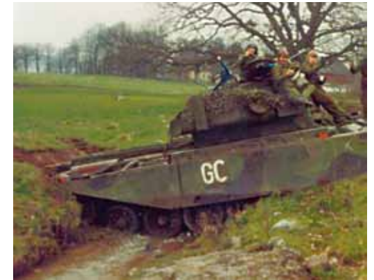
Vagn 80112 med besättning väntar på hjälp att komma vidare under PS-övningen 1983.

"Efter att vår vagn fastnat i en bäck nordost om Skrivaremöllan på Revingefältet. Incidenten inträffade i samband med framryckning, men eftersom bäckövergångarna var "upptagna" av de andra vagnarna fattade jag beslutet att vi borde klara framryckningen utan att använda överfarterna. Beslutet fattades efter en snabb bedömning från min plats i tornet och efter en kort dialog med föraren drog vi fram mot bäcken, men fastnade dessvärre på vägen upp. Efter några fruktlösa