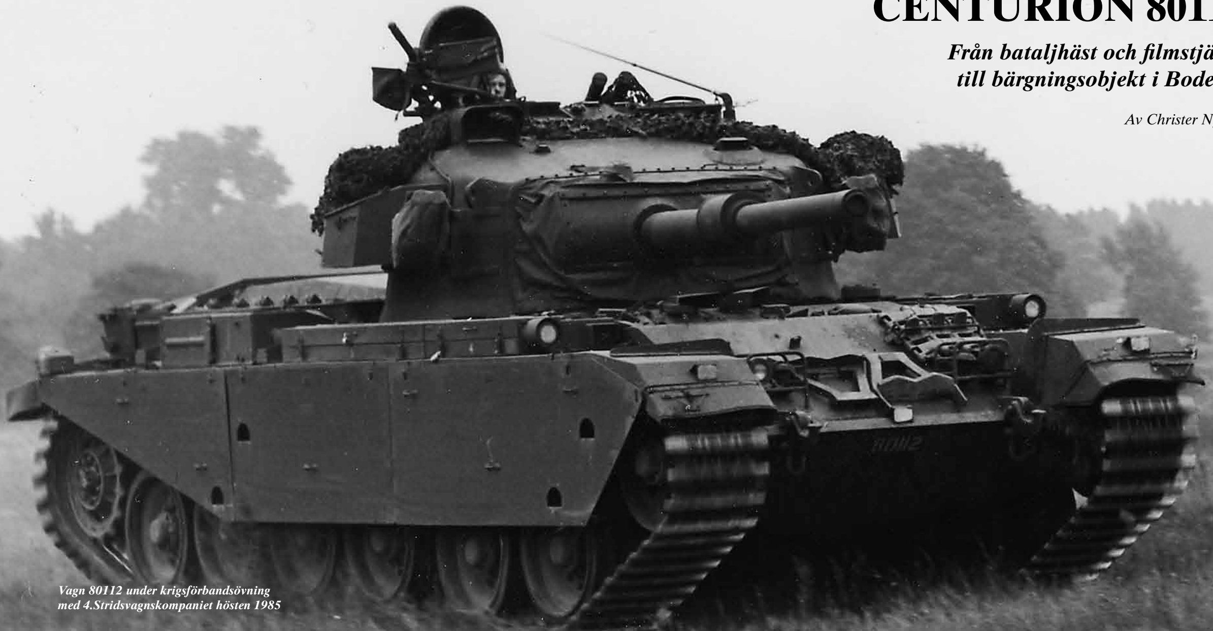
Vagn 80112 under krigsförbandsövning med 4.Stridsvagnskompaniet hösten 1985

P ansartrupperna var i mitten av 1950-talet det truppdrag i den svenska armén som hade prioriterats. En prioritering som förmodligen var helt riktig med tanke på hur flera kriser ute i världen hade haft ett stridsförlopp som dominerats av stridsvagnar. Koreakriget, oroligheter i Östtyskland,