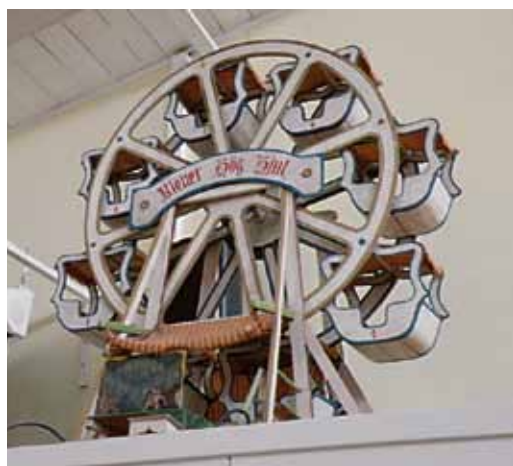
Det gamla pariserhjulet pryder fortfarande Matsalen

Befälsmatsalen, är upprustad och inredd som en modern mäss, med alla elektroniska hjälpmedel och automater. Sittgrupperna är snyggt inramade med prydnader påminnande om Norringetiden.