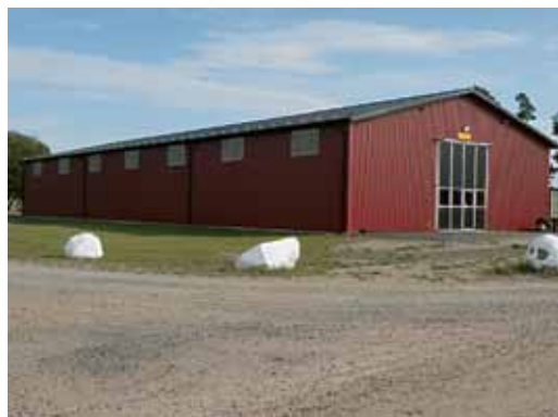
Det nybyggda förrådet "Dyrgripen"

don är inhysta i "Dyrgripen". Hemvärnet har fått nya förråd, som uppfyller de numera högt ställda säkerhetskraven.