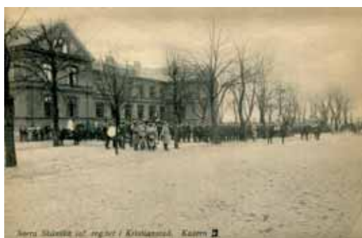
Norra Skånska inf.-reg:et, i Kristianstad. Kasern II (Södra skolan) Vykortet stämplat Ljungbyhed 13/8 1918 Förlag, Littorins bokhandel