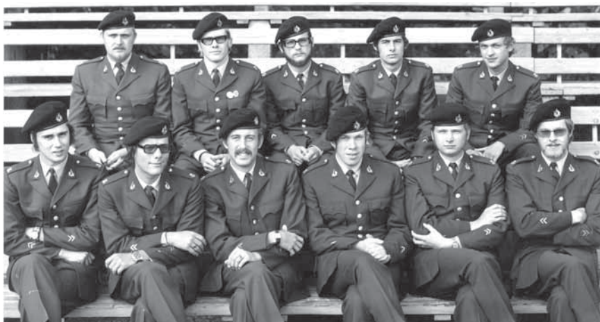
Kvartermästareskolan 1971, P6.

Glömmer inte när Ture lärde oss salta maten – med ”nävavis” med salt och inte med saltkar som vi var vana hemifrån. Kommer mycket väl ihåg det fantastiskt goda stekta fläsket vi tillagade under en utbildningsvecka i koktjänst på Rinkaby