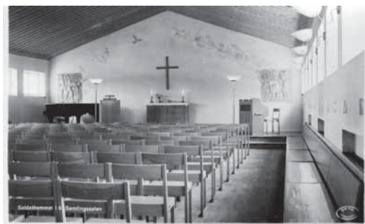
Soldathemmet I 6 Samlingsalen Vykortet är oanvänt. Förlag Soldathemmet I 6