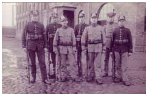
Kristianstad, vaktstyrkan utanför Kasern III. (Merkantil) Fotovykortet är stämplat Borrby 23/12 1915