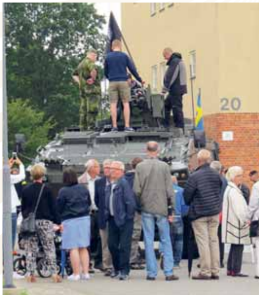
P 7 visar det nya fordonet PAT GB 360