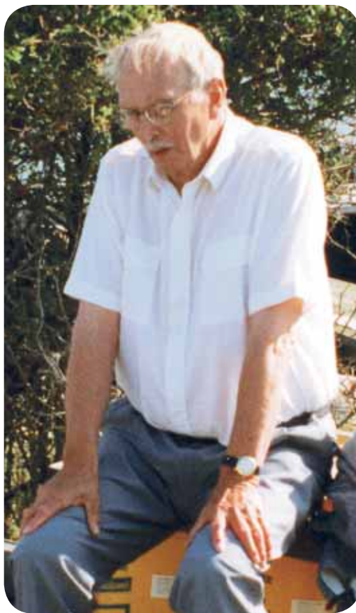
Vid Gråen 51 år senare