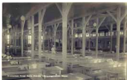
Kristianstad. Kungl. Norra Skånska Infanteriregementets Matsal Den 4/8 1956 brann matsalen ner. Den nya matsalen invigdes den 13/8 1958. Vykortet är oanvänt.