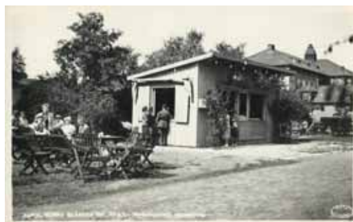
KUNGL. NORRA SKÅNSKA INF. REG:T. Marketenteriets uteservering (Byggdes i juni 1941) Vykortet oanvänt Förlag. Marketenteriet I 6. Kristianstad