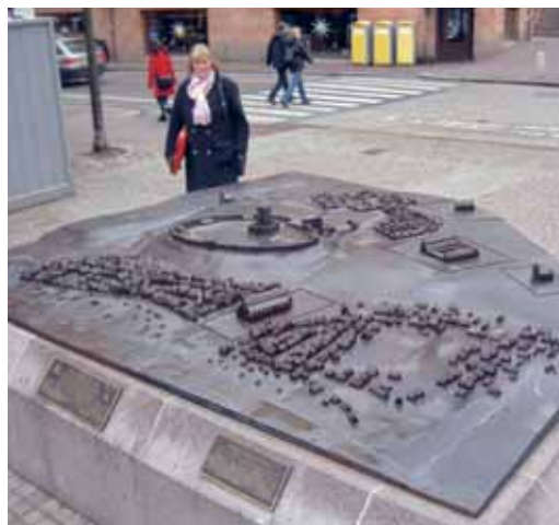
Bronsskulpturen "Helsingborg 1400" placerad på Stortorget.

Sven-Åke kom att spela en viktig roll i detta sammanhang och kom att vara behjälplig vid mina många utflykter till Litauen i samband med biltransporter