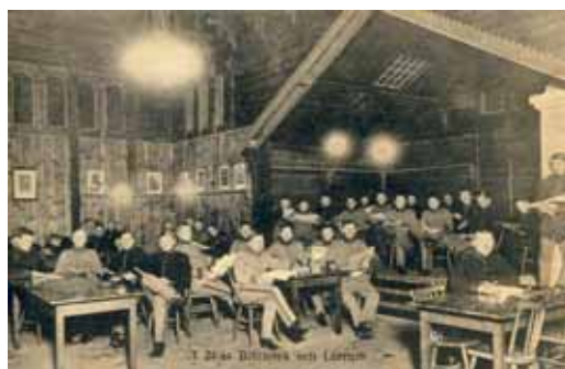
I 24:as Bibliotek och Läsrum (Fornstugan) Vykortet är oanvänt. Förlag Svenska Litografiska AB Stockholm