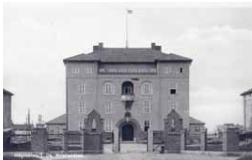
Högvakten. I 24. Kristianstad (Fotot är taget i början av 1920-talet) Skrivet och skickat? Förlag Hj Möllers Bokhandel. Christianstad