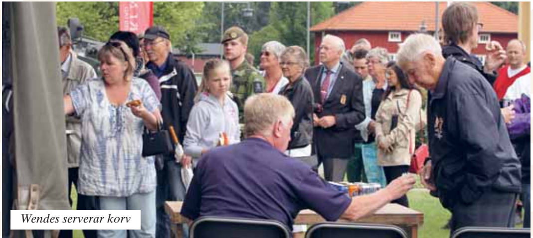
Wendes serverar korv