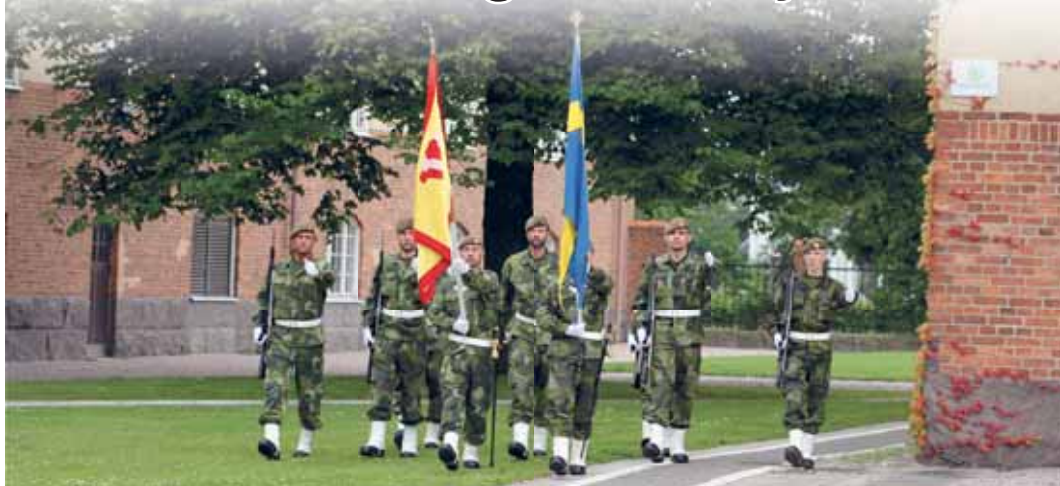
Fanvakt ur Norra skånska bataljonen. Björneborgarnas marsch