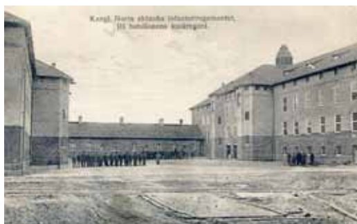
Kungl. Norra skånska infanteriregementet, III bataljonens kaserngård. Vykortet är stämplat Kristianstad 28/6 27 Förlag Svenska Litografiska AB Stockholm