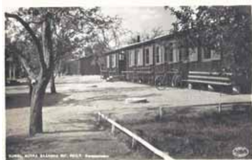
KUNGL.NORRA SKÅNSKA INF. REG:T. Barackstaden (Byggstart hösten 1940, färdigt april 1941) Vykortet är stämplat Kristianstad 22/5 49 Förlag och ensamrätt. Marketenteriet I 6.