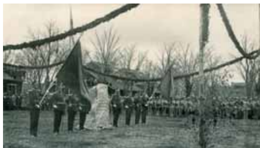
Avskedsceremonin Ljungbyhed. En minnessten avtäcktes den 10 maj 1923. Fotovykort, 10 maj 1923