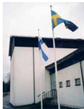
Det flaggas finskt och svenskt utanför samlingsalen.

Det skall tilläggas att allt började redan klockan 11.15. Då visades nämligen en tv-dokumentär I Stalins skugga . Den skildrar kortfattat Finlands tre krig 1939 – 1945 och hur Sovjetunionen kom att påverka landet ända fram till Stalins död 1953. En skakande film som stämde till eftertanke.