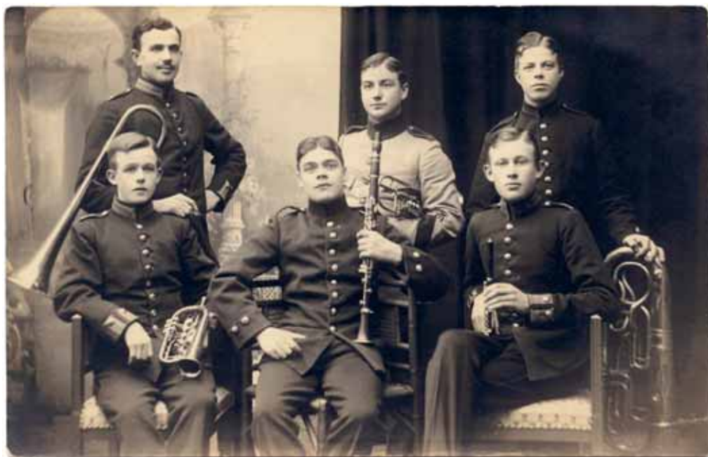
Unga Norringemusiker på Ljungbyhed som säkert övade på "Marsch auf Valencia några gånger.