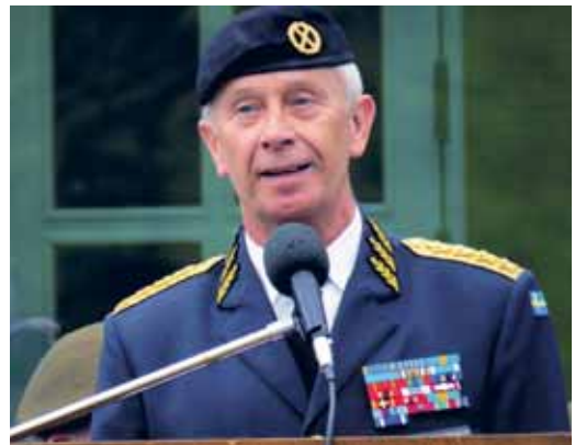
ÖB general Sverker Göranson

Äran före ditt tal. Skyldigheten ditt kunnande. Viljan din strid.”