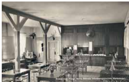
Kristianstad. Kungl. Norra Skånska Infanteriregementets Marketenteri. Vykortet är stämplat Kristianstad 6/10 -34