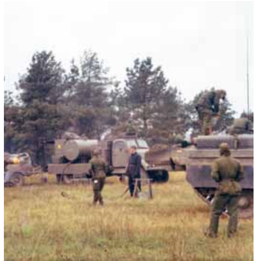
Tankning av ett strv S-kompani på Revingefältet.

Den 1 september blev vi värnpliktiga kopraller.