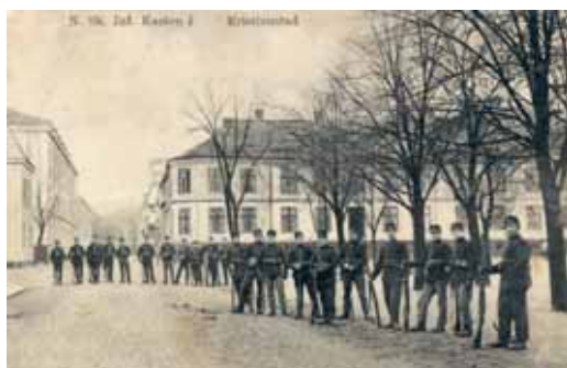
N. Sk. Inf. Kasärn I Kristianstad (Fattighuset) Vykortet stämplat Kristianstad 24/3 1916. Förlag Grahms Imp- & Export Affär Ovesholm