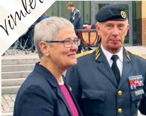
ÖB och hustru Ann