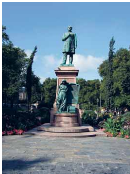
Staty av Runeberg i Esplanadparken i Helsingfors.

Den berömda marschens ord skrevs 1860 av Johan Ludvig Runeberg. Den 1 maj detta året sjöngs marschen för första gången av studenterna med dessa ord. De närvarandes förtjusning var obeskriverlig.