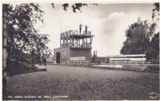
KUNGL.NORRA SKÅNSKA INF. REG:T. Friluftsbadet (Den 16/7 1936 invigdes regementets simbassäng) Vykortet är stämplat Kristianstad ?? Förlag och ensamrätt. Marketenteriet I 6.