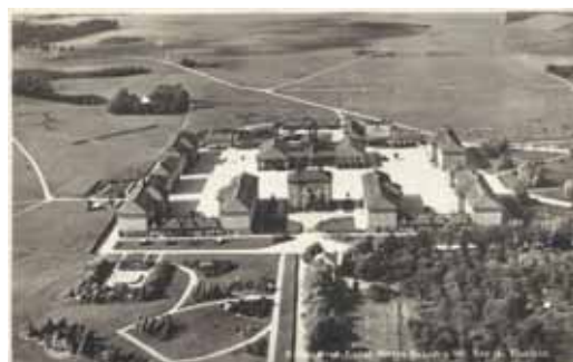
Kristianstad. Kungl. Norra Skånska inf. Reg:te. Flygfoto Fotot är från tiden 1922-1937. Observera, dansbanan finns kvar. Vykortet är stämplat Kristianstad 29/3 1937 Förlag Nilsson & Lewin Kristianstad